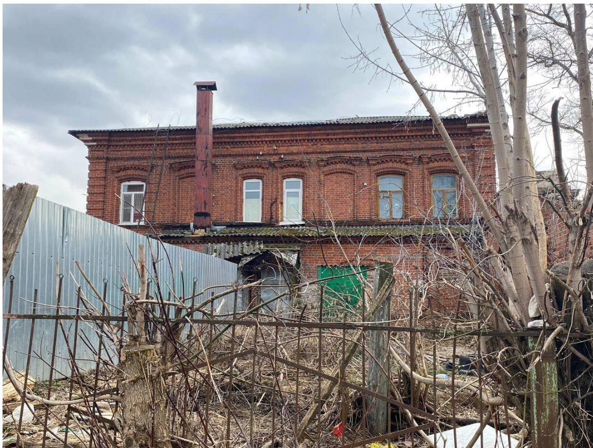
Фото 4. Общий вид северного фасада Объекта.