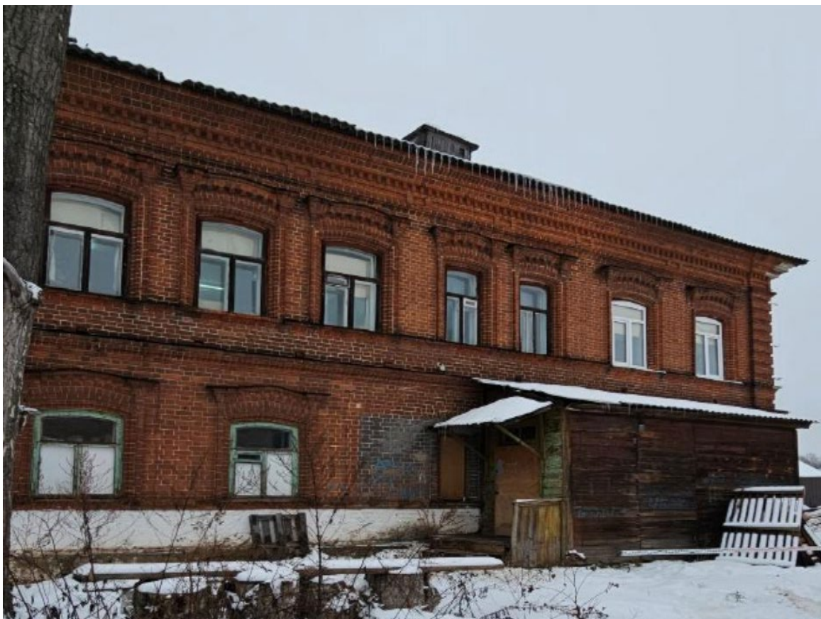
Фото 3. Общий вид южного фасада Объекта.