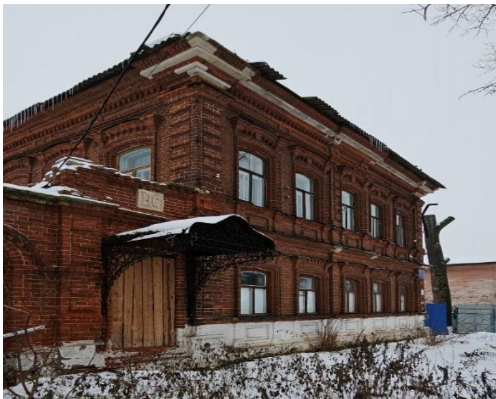
Фото 1. Общий вид Объекта со стороны западного фасада.

Фотографические изображения Объекта, полученные в ходе проведения настоящей историко-культурной экспертизы