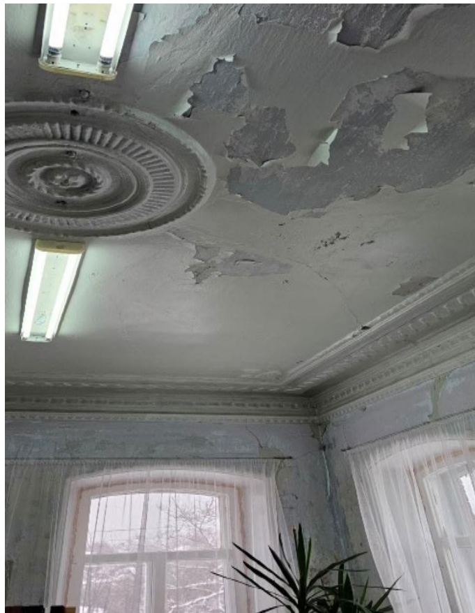
Фото 6. Интерьеры Объекта. Лепной декор в помещении второго этажа.